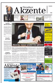
Titelseite Ausgabe 19/2010